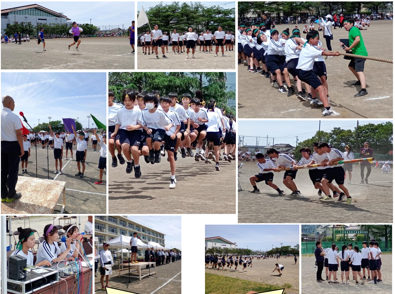
生徒会・専門委員会が活力祭を運営面から支えました。

さまざまな成果を、今後の日常生活に生かしていきます。そして、一人一人にあった支援をとおして、さらに「活力あふれる吉中生」の具現化を図っていきます。